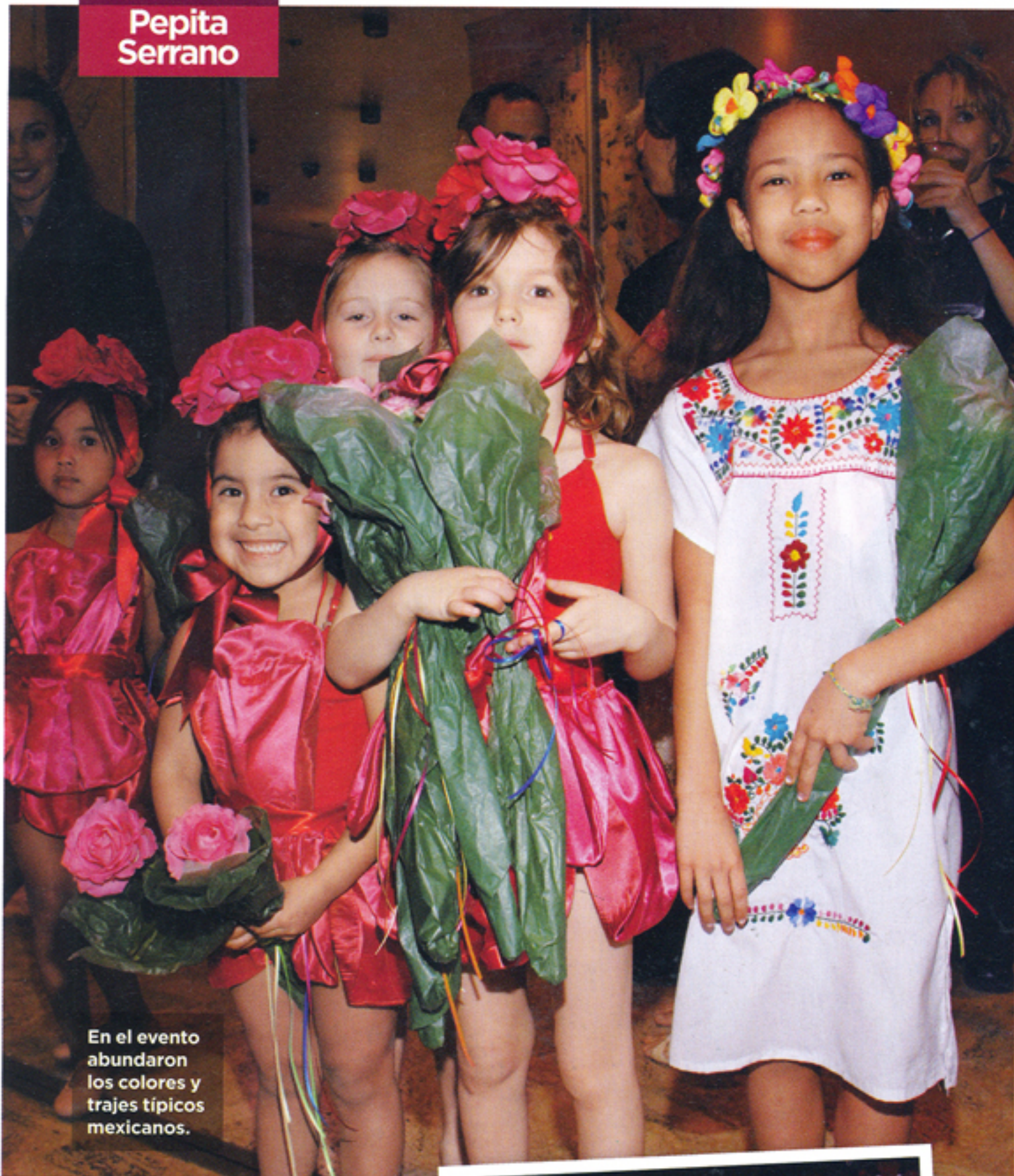
En el evento abundaron los colores y trajes típicos mexicanos.