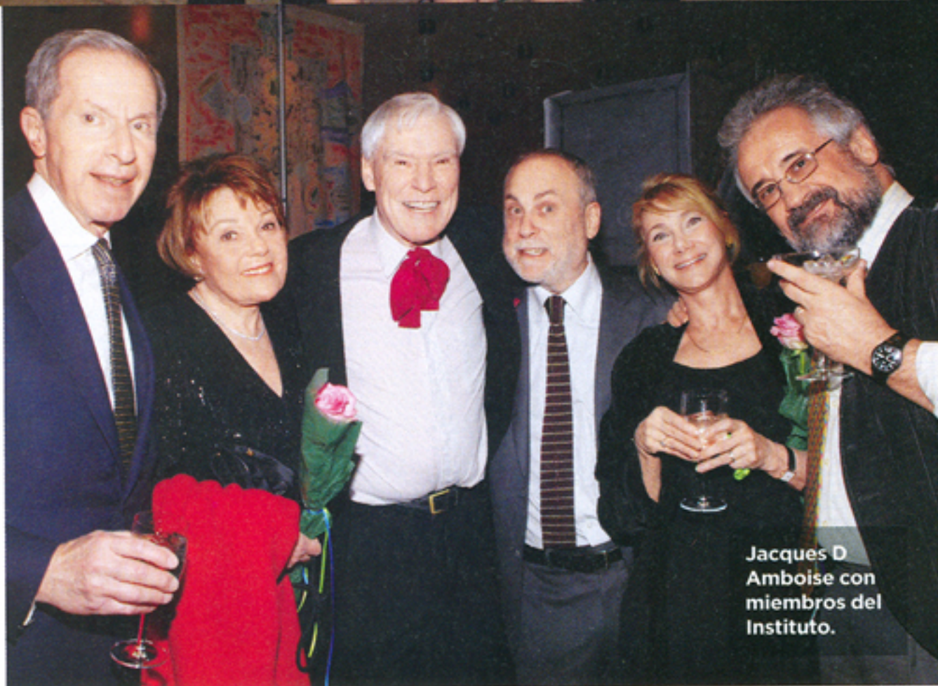
Jacques D Amboise con miembros del Instituto.